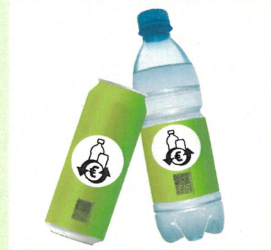
Grafik: EWP Recycling Pfand Österreich gGmbH